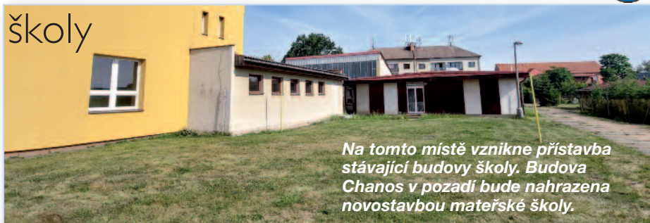
Na tomto místě vznikne přístavba stávající budovy školy. Budova Chanos v pozadí bude nahrazena novostavbou mateřské školy.

Stavba je naplánovaná na období červen 2024 až leden 2026. V rámci stavby bude nejdříve realizována nová dvoupatrová přístavba objektu školy,