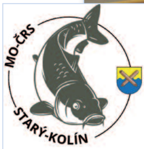
Logo vzniklé z vítězného návrhu