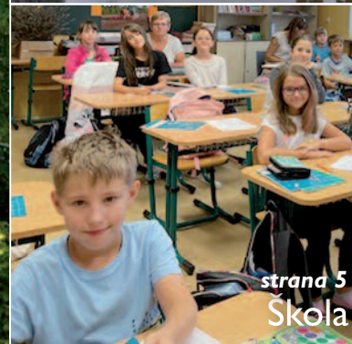
strana 5 Škola