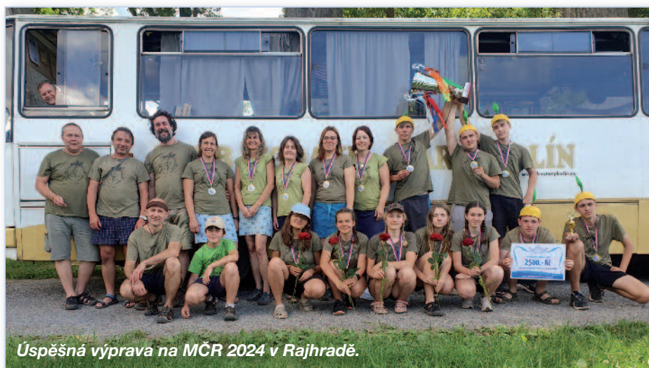
Úspěšná výprava na MČR 2024 v Rajhradě.

Další závody nás potom zavedly do Lovosic , následovaly Čelákovice a Štěpí , kde jsme opět měli možnost svést se