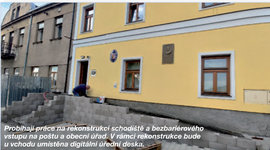
Probíhají práce na rekonstrukci schodiště a bezbariérového vstupu na poštu a obecní úřad. V rámci rekonstrukce bude u vchodu umístěna digitální úřední deska.